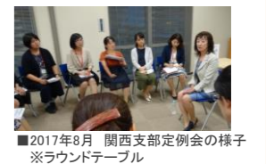
■2017年6月 関西支部定例会の様子 ※ラウンドテーブル