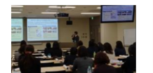
■2017年11月 関西支部定例会の様子