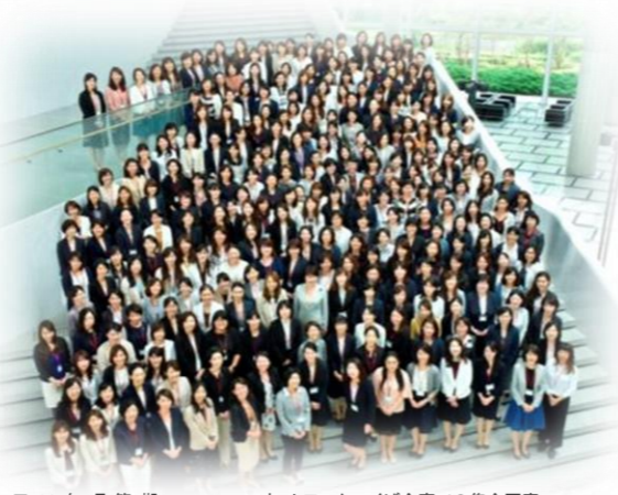
■2017年6月 第7期High Potentialネットワーク つば合宿での集合写真