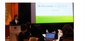
■2017年11月 海外研修 (カナダ・トロント)の様子